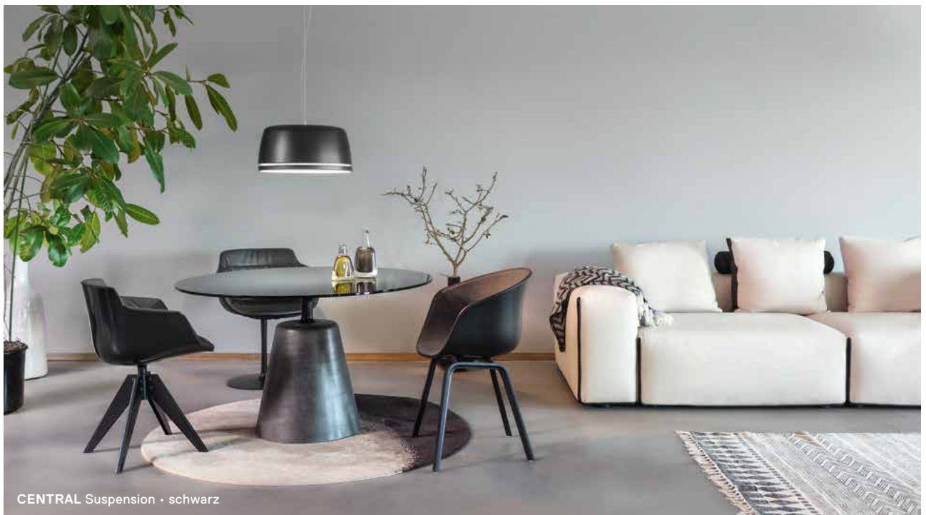
CENTRAL Suspension · schwarz

Central verbindet anmutiges Design mit hoher Funktionalität und Flexibilität. Kennzeichnend für die Leuchtenfamilie ist der prägnante Schirm, durch dessen Lichtfuge ein sanftes Licht in den Raum fällt und selbst zum gestalterischen Element wird. Als Pendelleuchte ist Central Suspension für vielfältige Einrichtungssituationen geeignet.