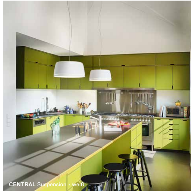
CENTRAL Suspension · weiß