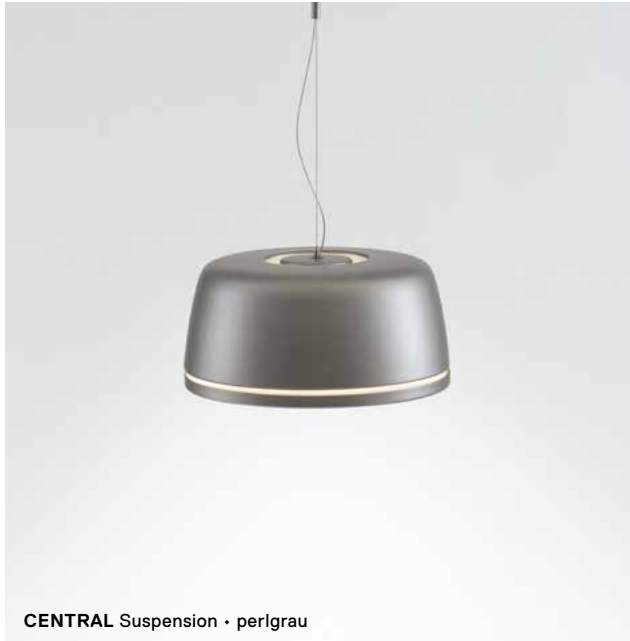
CENTRAL Suspension · perlgrau